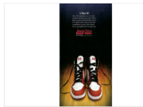
Jewel Osco 的广告版面

美国相关分析由此指出，“中国是否应当考虑认可‘公开权’？我的答案是，是的，中国应当这样做。为什么？也许，中国法院对乔丹的姓名及其飞人剪影的保护的拒绝就能充分地解释。”实际上，早在乔丹案发生前，我国就有相关学者对“公开权”的引入进行了一定的研究，我国法院此前也在一些涉及虚拟角色形象的案件中适用了“商品化权”，同时也引发了一定的争议，目前对此尚未有定论。鉴于目前人格权的适用及解释困境，“公开权”的引入也未尝没有适用的空间，当然，这还需要对中国法的理论与规范体系做认真的研究。